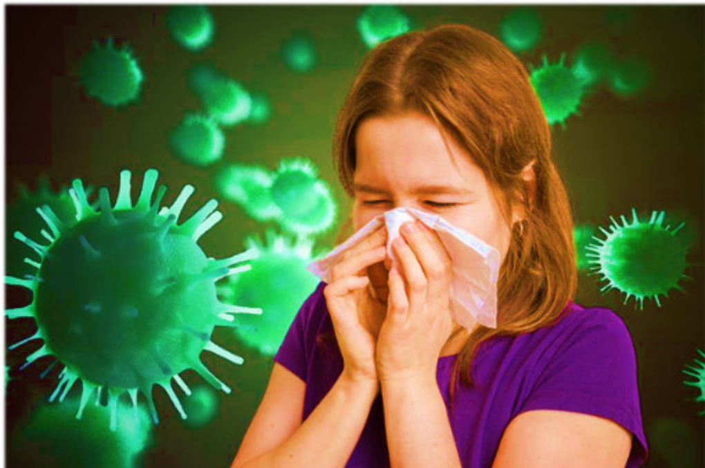
Как не заразиться