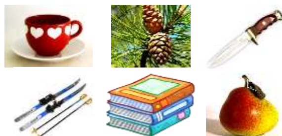
Рисунок 2. Картинки.