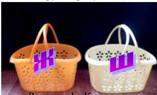
Рисунок 1 «Корзинки».

Игра «Корзинки» (рисунок 1) - детям предлагается отобрать картинки с соответствующей буквой, например Ш-Ж, чашка, шишка, нож, лыжи, книжки, груша (рисунок 2).