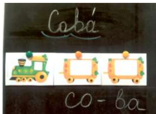
Рисунок 5. «Паровозик»

Игра «Паровозик». Задание: «Сколько слогов в слове? Прицепи к паровозу столько вагонов, сколько слогов в данном слове» (рисунок 5)