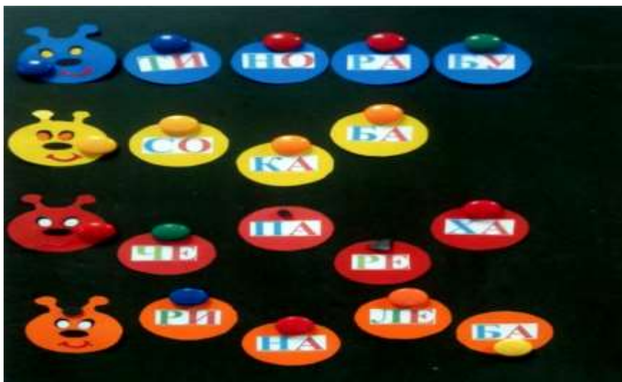
Рисунок 3. «Гусеница»

Игра «Гусеница» (рисунок 3) – детям необходимо собрать слово из слогов. Например: балерина, Буратино, черепаха, собака.